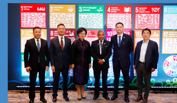
Тогтвортой хөгжлийн Үндэсний чуулганы хэлэлцүүлэгт оролцсон панелистүүд

НҮБ-ын дэмжлэгтэйгээр Монгол Улс нь Тогтвортой хөгжлийн зорилгын хэрэгжилтийн хоёр дахь удаагийн Үндэсний сайн дурын илтгэлээ бэлтгэж 2023 оны 7-р сард болсон НҮБ-ын Тогтвортой хөгжлийн улс төрийн дээд түвшний чуулга уулзалтад танилцуулсан билээ. Энэхүү илтгэл нь Монгол Улсын ТХЗ-ын хэрэгжилтийн явц, бодлого, хүчин чармайлтууд, эхний илтгэлээс гарсан зөвлөмжийн биелэлт зэрэгт үнэлгээ өгсний зэрэгцээ КОВИД-19 цар тахлын нөлөө, геополитикийн зөрчил мөргөлдөөний нөлөөллийг ч мөн судалсан. Түүнчлэн анхаарлаас гадна орхигдох эрсдэлтэй байгаа хүн амын бүлгүүдийг тодорхойлох, тогтвортой байдалд нөлөөлж буй бүс нутгийн хөгжлийн ялгааг судалсан байна.