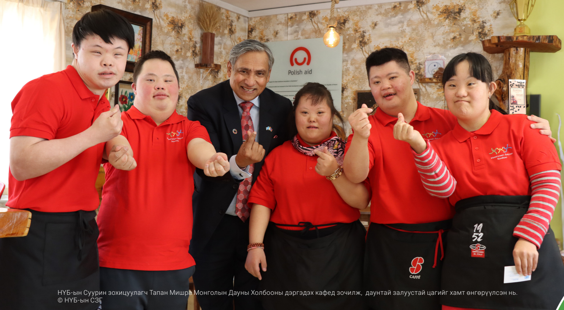
НҮБ-ын Суурин зохицуулагч Тапан Мишра Монголын Дауны Холбооны дэргэдэх кафед зочилж, даунтай залуустай цагийг хамт өнгөрүүлсэн нь.

2023 онд стратегийн нэгдүгээр тэргүүлэх чиглэлийн хүрээнд НҮБ-ын системийн 11 байгууллага хэрэгжүүлэгчтүншүүдтэйгээ хамтран үндэсний хэмжээнд 51 дэд үр дүнгийн хүрээнд үйл ажиллагаа явуулж, 14.9 сая ам.долларын санхүүжилтийг олгосон байна.