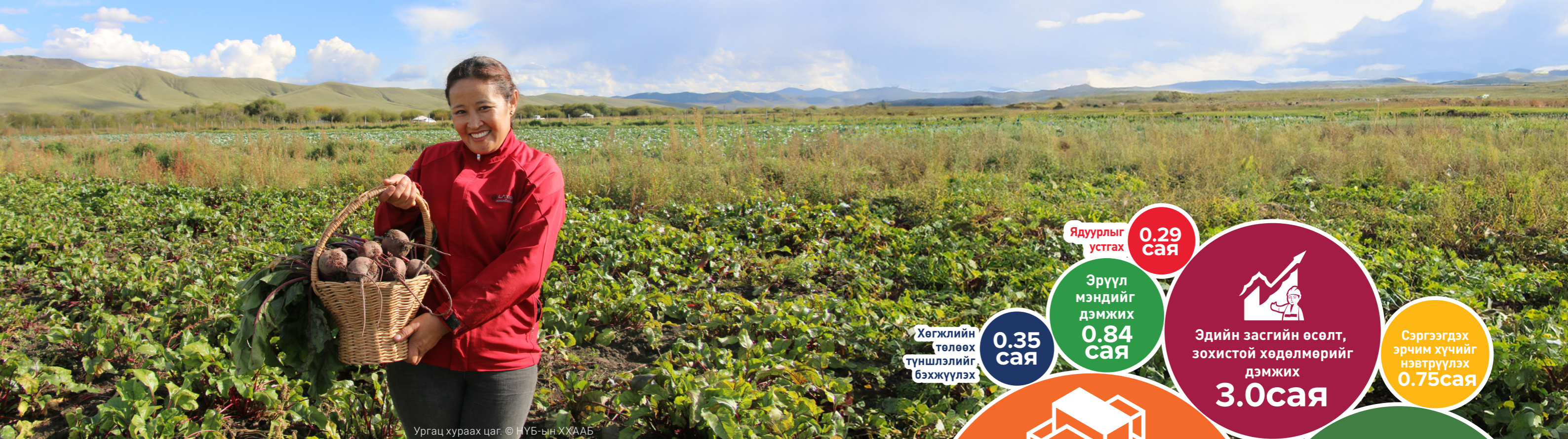
Ургац хураах цаг.

Тайлант жилийн хугацаанд стратегийн хоёрдугаар тэргүүлэх чиглэлийн хүрээнд НҮБ-ын системийн 17 байгууллага нь хэрэгжүүлэгч талуудтайгаа хамтран улсын хэмжээнд нийт 67 дэд үр дүнгийн хүрээнд ажиллаж, 22.8 сая ам.долларын санхүүжилт хийсэн.