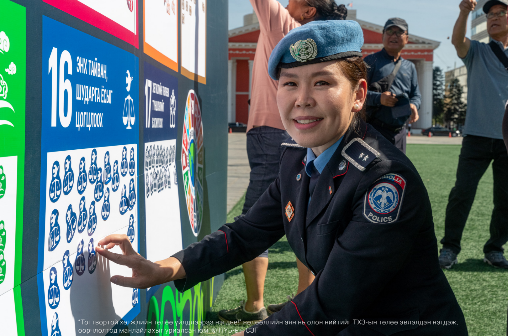
"Тогтвортой хөгжлийн төлөө үйлдлээрээ нэгдье!" нөлөөллийн аян нь олон нийтийг ТХЗ-ын төлөө эвлэлдэн нэгдэж, өөрчлөлтөд манлайлахыг уриалсан юм.